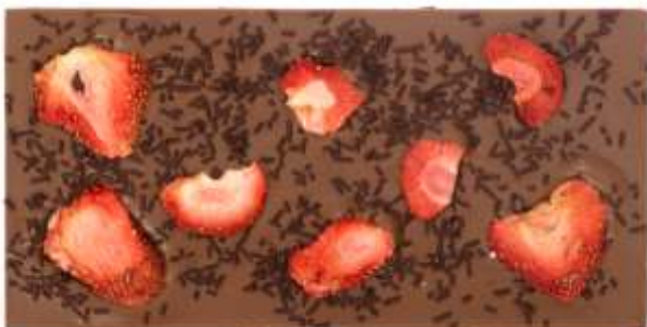
Mléčná, jahody, čokoládová rýže