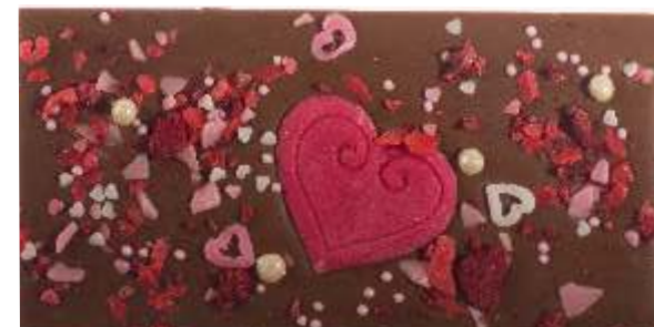
Mléčná, maliny, cukrové srdce