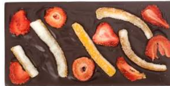
Hořká, jahody, pomerančová kůra