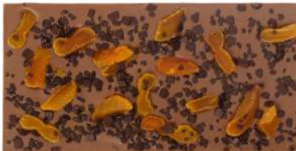
Mléčná, sušené meruňky, čokoládový posyp