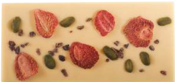
Bílá, jahody, pistácie