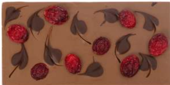
Mléčná, hořká čokoláda, brusinky