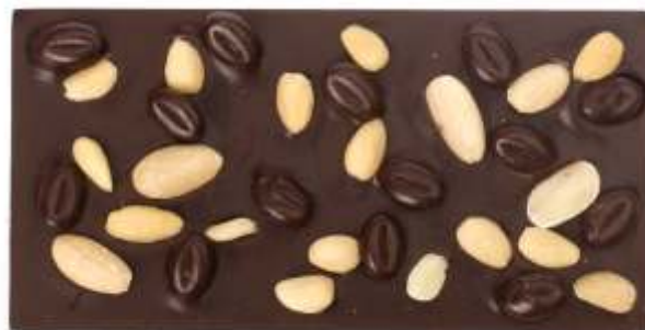
Hořká, kávové zrna, mandle