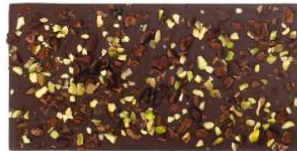
Hořká, pistácie, kakaové boby drcené